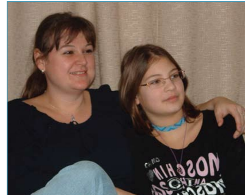
Mikor diagnosztizálták gyermekénél a diabetest?

Két éves korában. Feltűnt, hogy állandóan szomjas és levert volt. Az én örökmozgó lányom, egyik napról a másikra alig állt a lábán. Mivel ez nyáron történt a 40 fokban, azt mondta az orvos, biztos a meleg viseli meg, ezért azt tanácsolta várjunk... Hétvégén az ügyeleten kötöttünk ki, ekkor már acetonszagú volt a lehelete, nem bírt felállni. Azonnal inzulinozni kezdték.